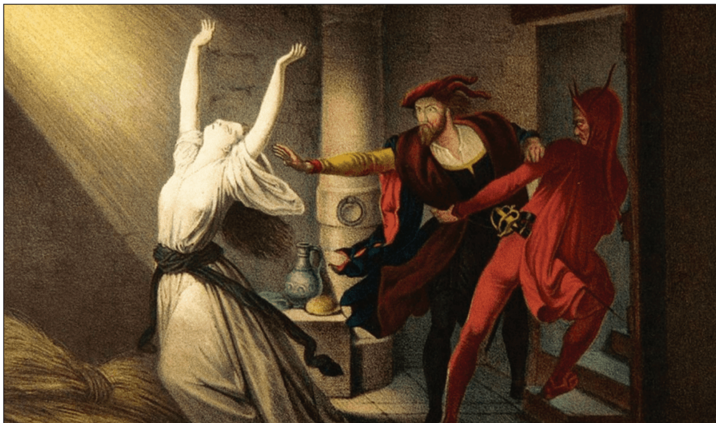
«Фаўст і Мефістофель у падзем'і». Літаграфія Ёзэфа ФАЯ, 1848 год

Адно зразумела: пакуль чалавек хоча больш, чым яму належыць па рэгламенце, Фаўст будзе жывы, а д'ябал будзе яго пераследваць.