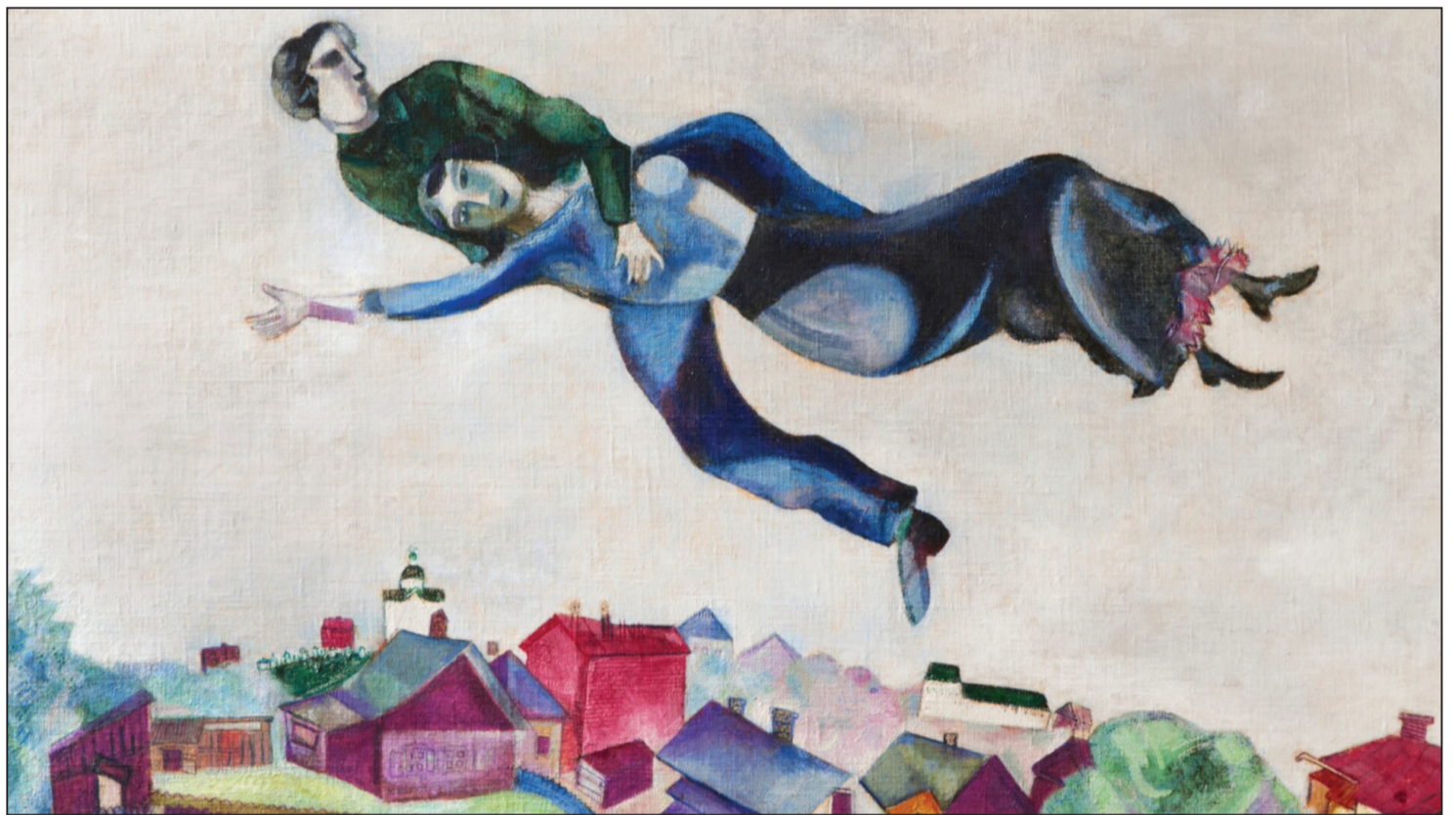
Фрагмент работы Марка ШАГАЛА «Над горадам. 1914–1918 гг.

Гэта кожны дзень тыдня можна есці посны суп ці бацвінне, простую кашу і запіваць малаком. Суботняя ежа павінна прыносіць чалавеку радасць і задавальненне, а таму яе прыгатаванне — асаблівы рытуал, сакральнае дзеянне! Узяць, напрыклад, хоць таго самага шчупака, якога фаршыруюць яўрэйскія жанчыны. Нідзе вы не пакаштуеце такога смакоцця! Па асабліваму рэцэпту, з выкарастаннем патаемных сакрэтаў, якія перадаюцца ў спадчыну ад маці да дачкі, гатуецца гэтая страва. Нават калі вам пашчасціць выведаць гэты рэцэпт, у вас не атрымаецца нічога падобнага да яўрэйскага фаршыраванага шчупака!