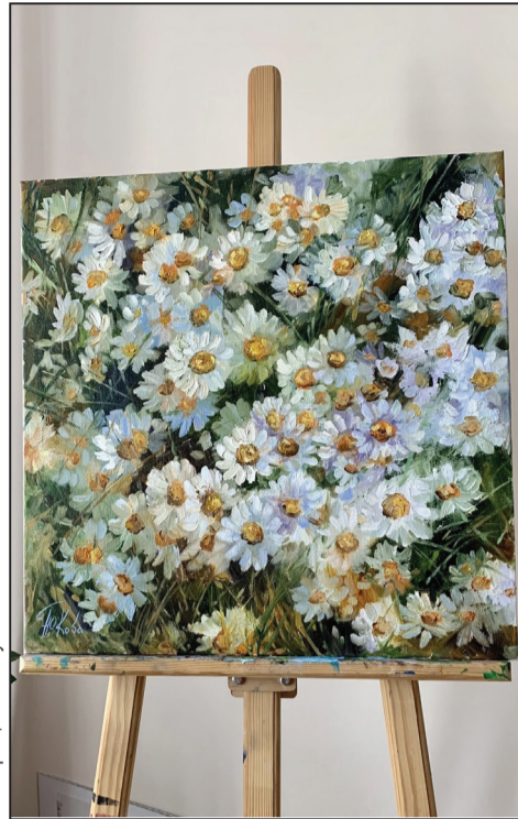
Ілюстрацыя Yuliya KOVA

— Чакай! Не веру! На якім ты свеце?.. Хаця не важна, і я на тым... — Ты памятаеш, як б'ецца маё сэрца? Паслухай!..